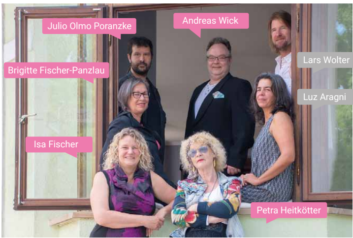
Der Vorstand des Vereins KUNST.HAFEN.WALLE e. V. mit den Vermietern der ehemaligen Kneipe.