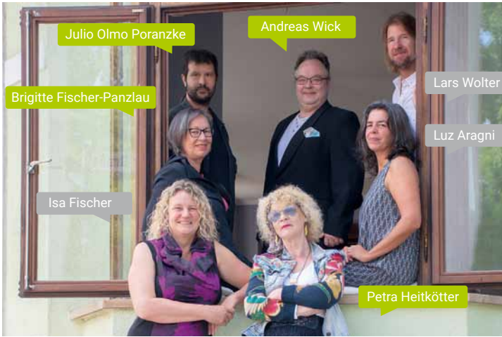
Der Vorstand des Vereins KUNST.HAFEN.WALLE e. V. mit den Vermietern der ehemaligen Kneipe.