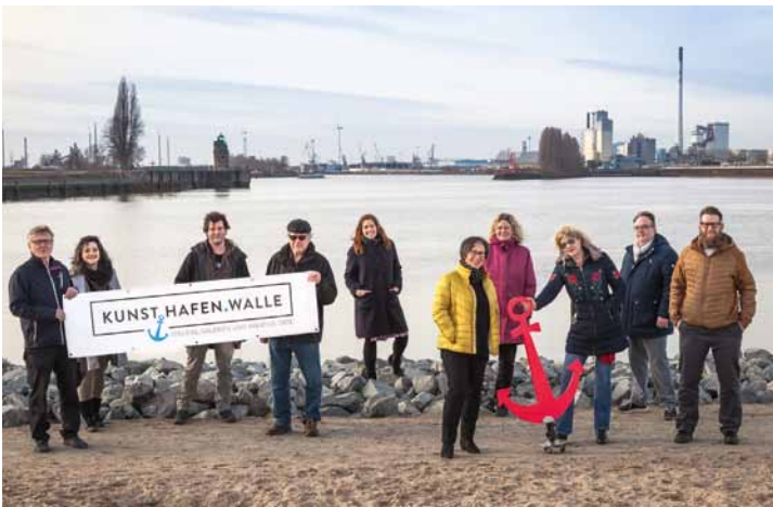
Vereinsmitglieder des KUNST.HAFEN.WALLE e.V.

Der Verein KUNST.HAFEN.WALLE hat die ehemalige Eckkneipe »Freiraum« in der Helgolander Straße 22 in Walle zu neuem Leben erweckt. Unter dem Namen FREIRAUM.KUNST ist ein Treffpunkt für Künstler*innen, ein Ort der Begegnungen und eine Galerie entstanden. Die Idee einen »Show-Room« für Künstler*innen zu schaffen entstand mitten in der Corona-Pandemie und konnte Dank der finanziellen Unterstützung aus dem »Aktionsprogramm Stadtteilzentren« der Senatorin für Wirtschaft schnell umgesetzt werden. Die dritte Ausstellung trägt den Titel »Fotografische Interpretationen & Emotionen: Vergangene Augenblicke« und wird von dem Fotokünstler Olmo kuratiert. Die Ausstellung wird am 30.09. um 19 Uhr eröffnet. Bis zum 29. Oktober werden in der temporären Galerie fotografische Arbeiten von sechs Bremer Künstler*innen gezeigt. Eine weitere Ausstellung folgt.